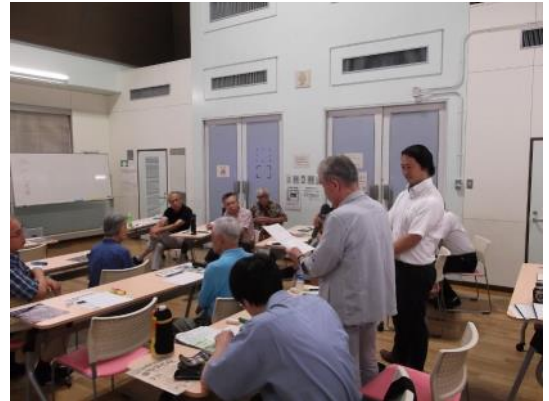
講座の様子 (ワークでの受講者発表)

特にワークでは会場の雰囲気は一体感も増し、終了後に参加者同士が情報交換し合う場面も見られました。