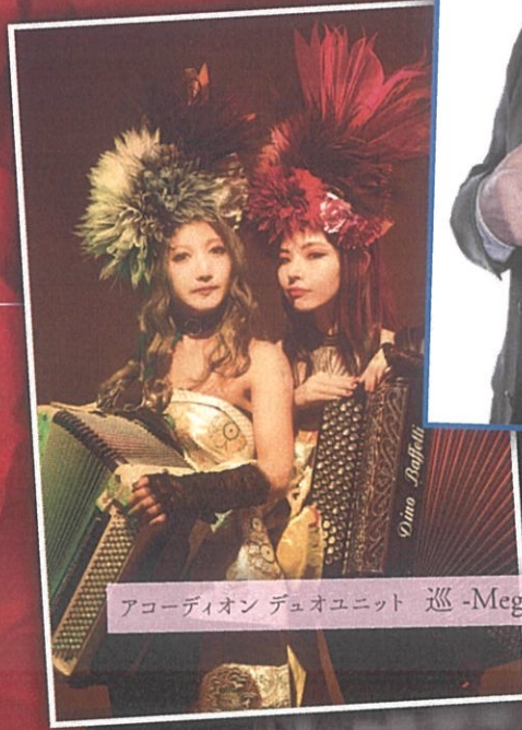
アコーディオン デュオユニット 巡 -MeguRee-