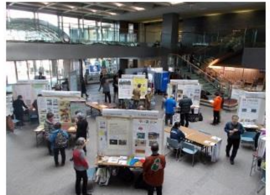
▲開放感のある会場

平成30年2月26日（月）から一週間を「市民活動WEEK」とし、市役所1階市民ホールを会場に、生涯学習ボランティア人材バンクフェア「まちの先生紹介！！」を2日間、「市民活動見本市」を3日間、開催しました。