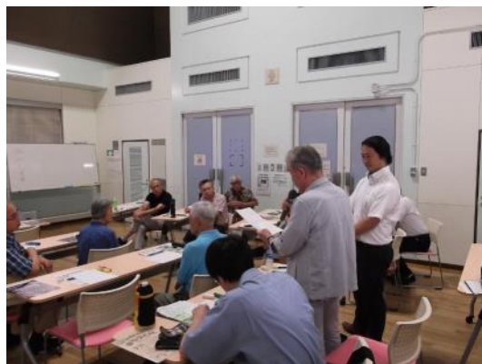
講座の様子 (ワークでの受講者発表)

特にワークでは会場の雰囲気は一体感も増し、終了後に参加者同士が情報交換し合う場面も見られました。